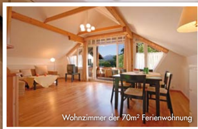
Wohnzimmer der 70m 2 Ferienwohnung