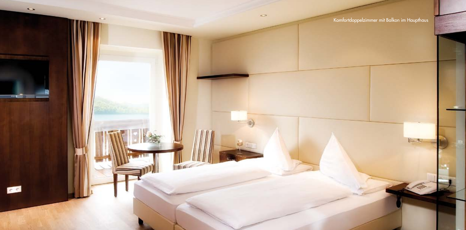
Komfortdoppelzimmer mit Balkon im Haupthaus