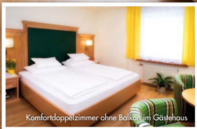
Komfortdoppelzimmer ohne Balkon im Gästehaus