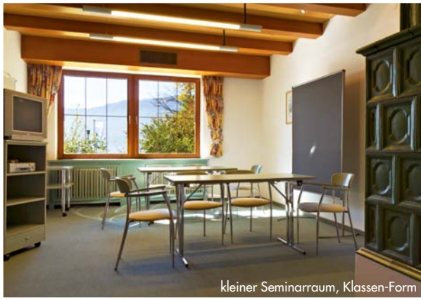
kleiner Seminarraum, Klassen-Form