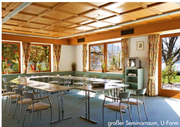
großer Seminarraum, U-Form