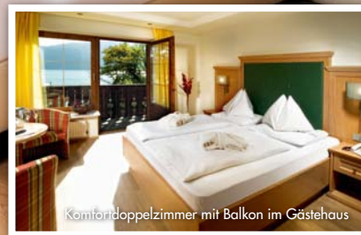
Komfortdoppelzimmer mit Balkon im Gästehaus